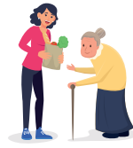
עזרה לגר ליתום ולאלמנה Helping a convert, orphan or widow

The Jewish people were strangers in Egypt and we therefore need to show empathy and help those who are new in our surroundings and those who don't have close relatives to help them, such as the orphan and the widow. Who am I?