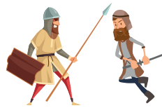
המלחמה בעמלק The war against Amalek

When the Jewish people left Egypt, a people living in the desert waged war with them. The Exodus from Egypt and this war may not be forgotten, according to the Torah. Who am I?