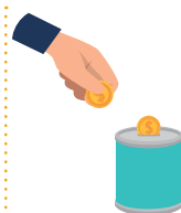
מתנות עניים Giving to the poor

I am an important Mitzva to do with giving. When you see a person who is lacking, or who is in trouble, I appear. When the Jewish people were in Egypt, no-one saw them or helped them. In memory of the Exodus from Egypt, we need to remember that we are all equal and that we must look around us and help the poor. What am I?