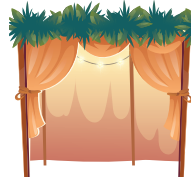
חג הסוכות Sukkot

When the Jewish people left Egypt, the Clouds of Glory protected them. To remember this miracle, you build me after Yom Kippur, decorate me and sit in me for seven days. What am I?