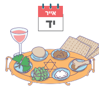
פסח שני Pesach Sheni

I am a special festival for whoever didn't celebrate Pesach in the month of Nissan. Whoever was too far away or didn't manage to celebrate in Nissan, celebrates me on the 14th of Iyar. I am not the first Pesach. What am I?