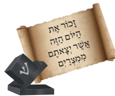
הנחת תפילין Putting on Tefillin

You receive me at a Bar Mitzvah and put me on your head and arm. I contain 4 sections from the Torah which talk about the Exodus from Egypt. What am I?