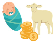
מצוות פדיון בכורות Redeeming the firstborns

During the plague of the Firstborns in Egypt the firstborn Egyptians died, but the firstborn Jews were saved. To remember this miracle, whenever a firstborn boy is born, we say thank you and give silver coins. What am I?