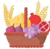
ביכורים Bringing the first fruits to the Temple

From the time of Shavuot, the farmer would gather the first fruits from his trees, put them in a basket, and bring them up to Jerusalem. He understood that every fruit was special and said thank you for it, mentioned the Exodus from Egypt which resulted in the Jewish people returning to their land, and ate the rest of his fruits with joy. What am I?