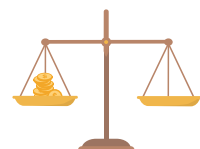
ישר במידות ובמשקולות Being honest as a person and in business

The Jewish people left Egypt and were told not to behave like the Egyptians. The Jewish people need to behave honestly, and should not deceive or steal. What am I?